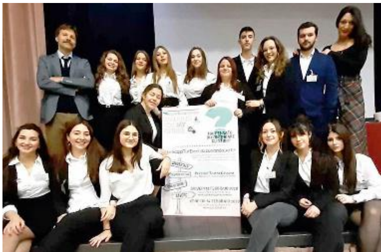
Gli studenti dello Scappi sul palco del Cassero nelle giornate di orientamento